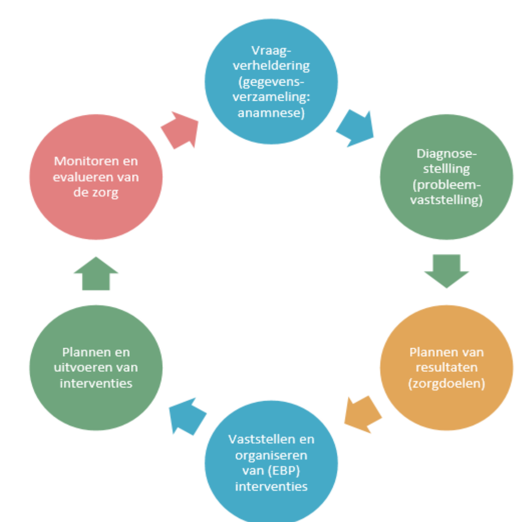
Figuur 2. Het stappenplan 'verpleegkundig proces' uit het begrippenkader indicatieproces (Harder et al. 2019)